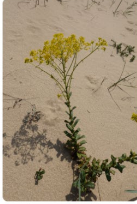
Isatis arenaria – Kelebek otu