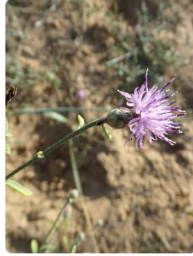
Centaurea kilaea - Kilyosdüğmesi