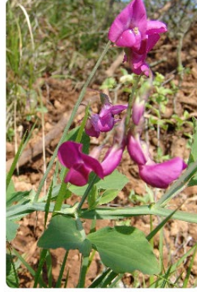
Lathyrus undulatus - İstanbul Nazendesi