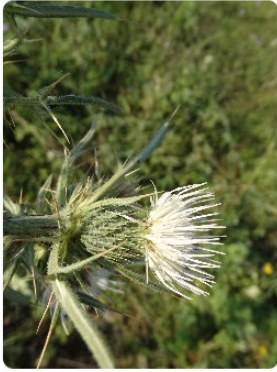
Cirsium byzantinum- Hoşkangal