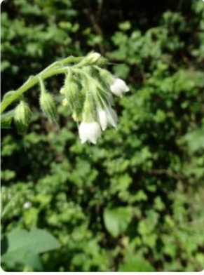
Symphytum pseudobulbosum – Karakafes otu