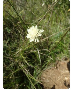
Cephalaria tuteliana Sultan pelemiri