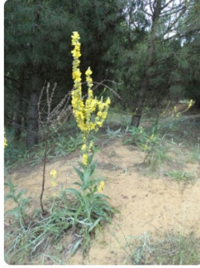
Verbascum degenii – Riva Sığırkuyruğu

İstanbul Büyükşehir Belediyesi verileri ile hazırlanmıştır .