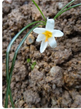
Crocus pestalozzae- Ümraniye çığdemi