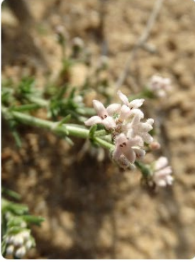
Asperula littoralis - Kum belumotu

Fotoğrafları bulunan 14 adet endemik bitkinin isimleri