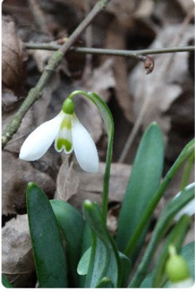
Galanthus byzantinus – İstanbul kardeleni