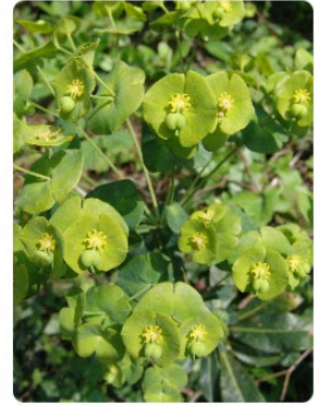
Euphorbia amygdaloides- Zerene,Sütleğen