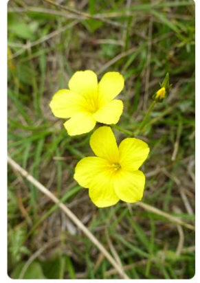
Linum tauricum Boğaziçi Keteni