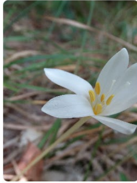
Colchicum micranthum- Narin acıçığdem